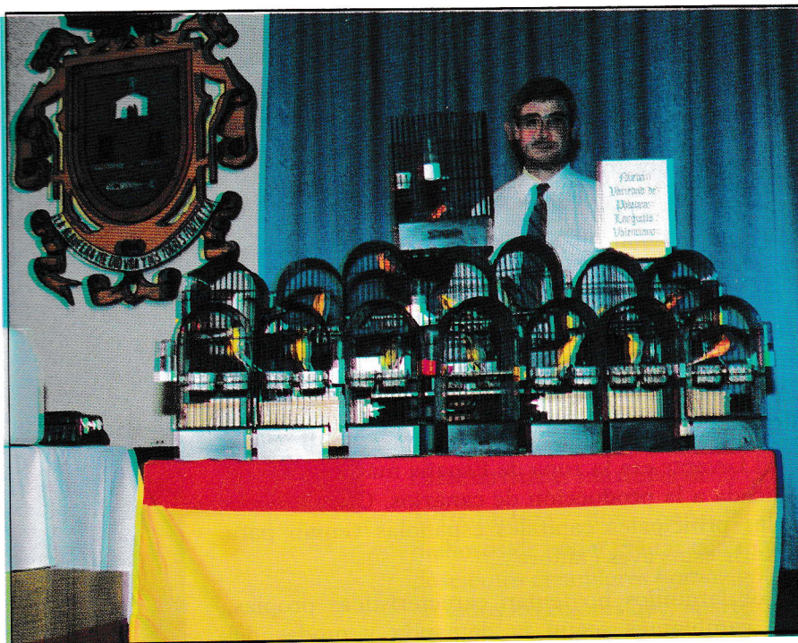
Conjunto de larguillos en San Javier, Murcia.

Pienso que el Larguillo debe construir su popularidad en base a sus propias cualidades y no