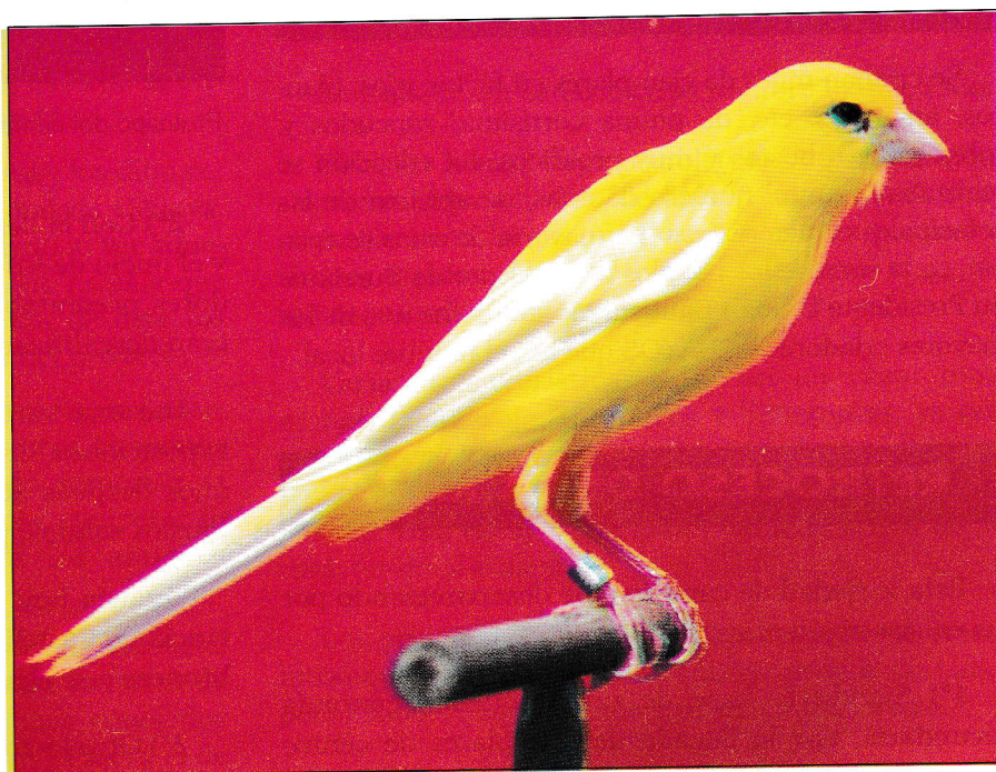
Larguillo intenso, actitud de reposo.